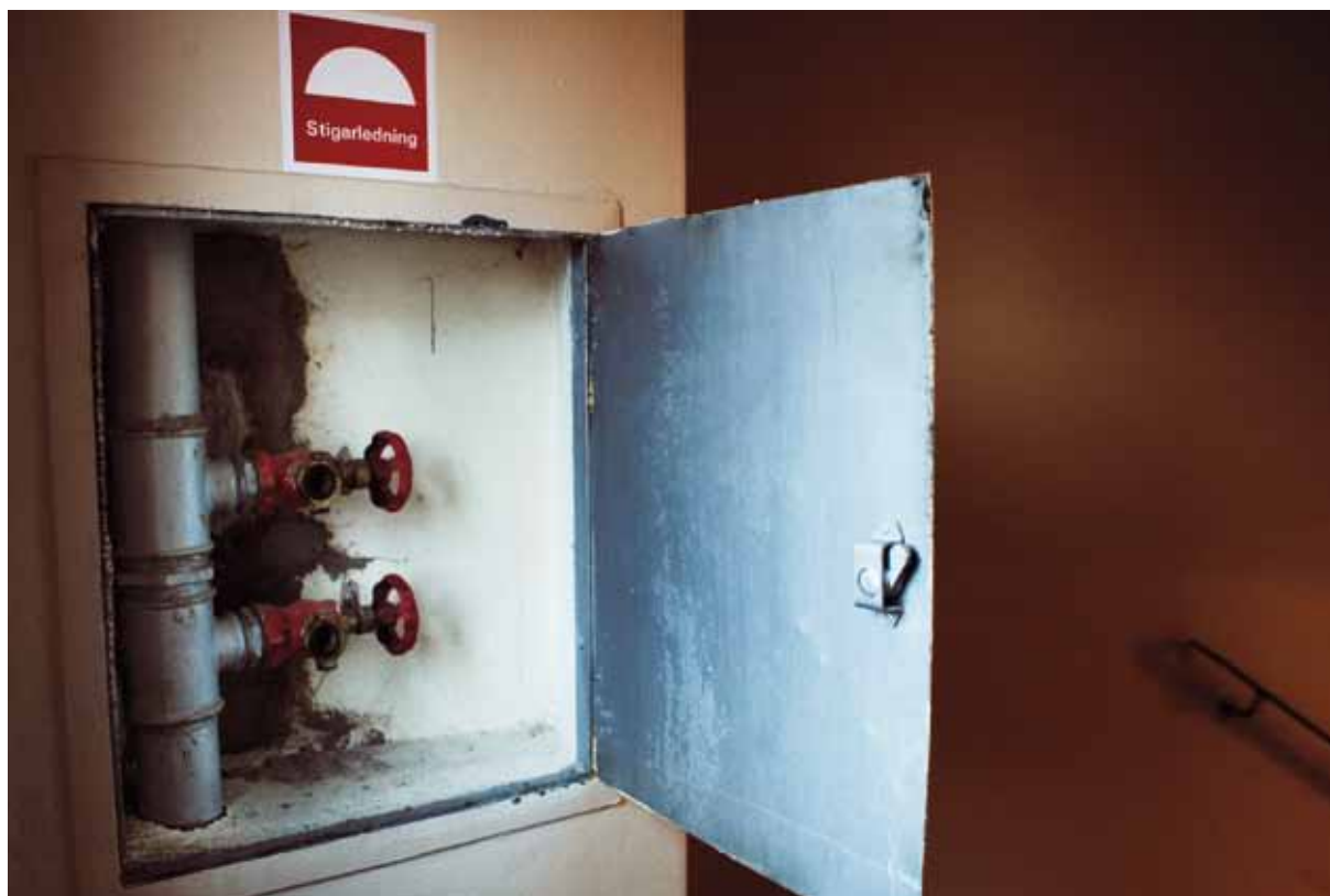
Via stigarledningen i trapphuset får räddningstjänsten vattenförsörjning utan att behöva dra slangar hela vägen från bottenvåningen.