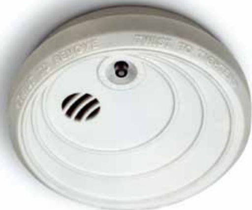
Det ska finnas minst en uppsatt och fungerande brandvarnare i varje lägenhet. Billigare liv- och egendomsförsäkring är svårt att hitta.

brandvarnare installeras, men att de boende sedan själva ansvarar för att regelbundet prova att den fungerar och byta batterier vid behov.