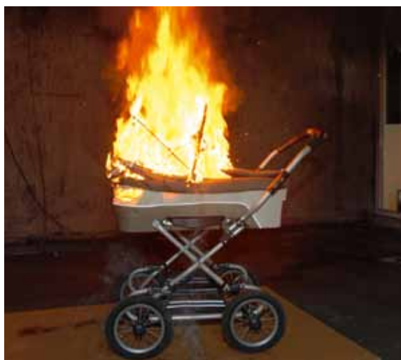
Håll trapphuset fritt från brännbart material och sådant som är i vägen vid en utrymning.

uthyrningen är det lämpligt att den som hyr ut lokalen för en dialog med hyresgästen om hur brandskyddet är tänkt att fungera när det gäller utrymningsvägar, tillåtet antal personer, eventuella larm med mera. I vissa fall kan det också vara lämpligt att tillsammans gå igenom lokalen/lokalerna innan de tas i bruk för arrangemanget. Det bör också finnas någon form av skriftlig brandskyddsinformation och checklista till hyresgästen. Sådana bör också vara uppsatta i lokalen.