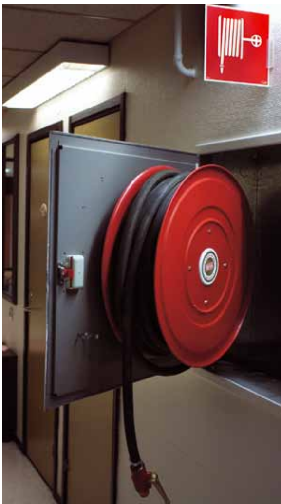
En vattenslang i styv plast är lätt att hantera och finns alltid på plats.