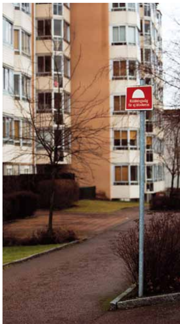
Räddningsvägar ska hållas snöröjda och fria från andra hinder.

Garage förses lämpligast med pulversläckare eftersom pulver är effektivt mot motorbränder. En sådan fungerar på de flesta typer av bränder och kan användas även för övriga utrymmen. Handbrandsläckare riskerar att bli stulna. Vill man ha släckutrustning i allmänna utrymmen kan vattenslang på rulle i ett fast skåp vara ett bra alternativ.