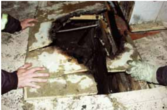
Felaktigt hanterad aska är en vanlig brandorsak. Här har golvet brunnit när aska från en kakelugn som det eldats i dagen före ställts i en plastpåse på golvet.

Bränder i bostäder är ofta eldstadsrelaterade. Därför är det viktigt att uppmärksamma säkerheten kring eldstäder. De boende behöver informeras om vad som gäller för de lokala eldstäder som finns i fastigheten, exempelvis kakelugnar och öppna spisar. Viktig information är om det får eldas i dessa, vad som i så fall får eldas, i vilken omfattning det får eldas och hur askan ska hanteras.