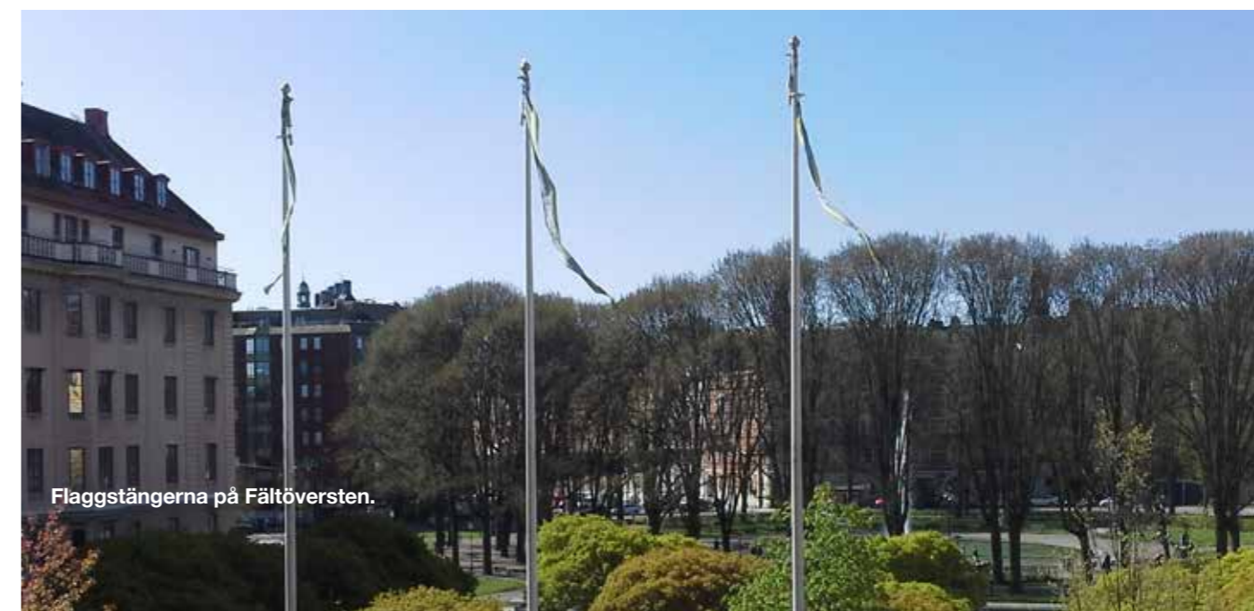
Flaggstängerna på Fältöversten.