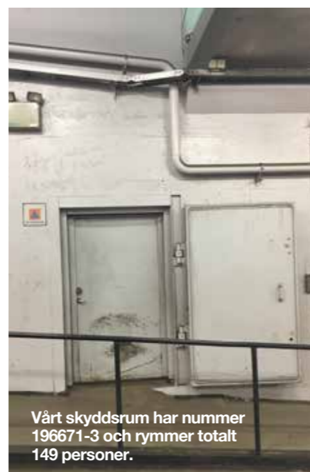
Vårt skyddsrum har nummer 196671-3 och rymmer totalt 149 personer.