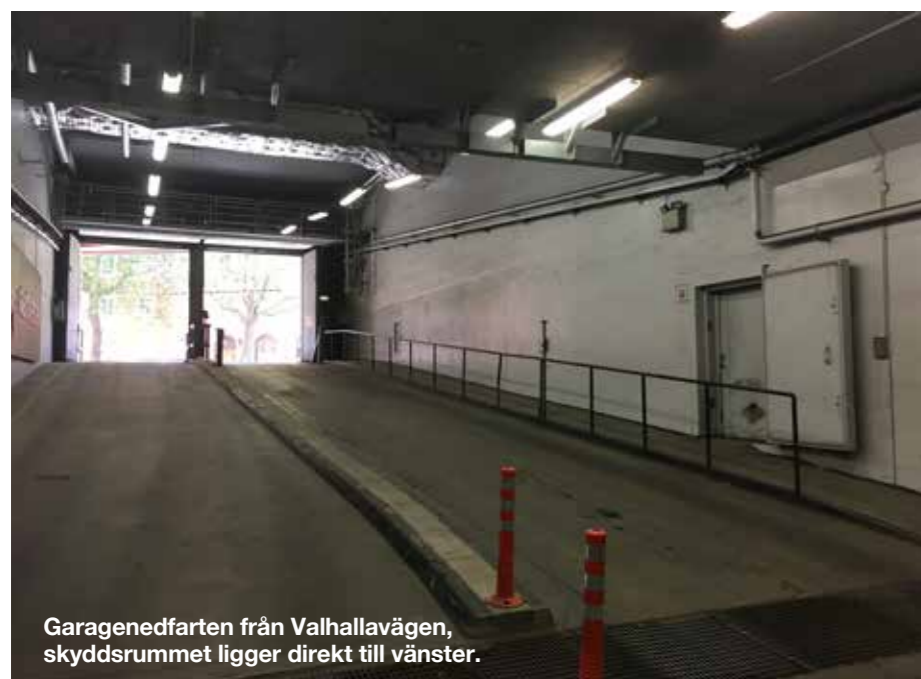
Garagedfarten från Valhallavägen, skyddsrummet ligger direkt till vänster.