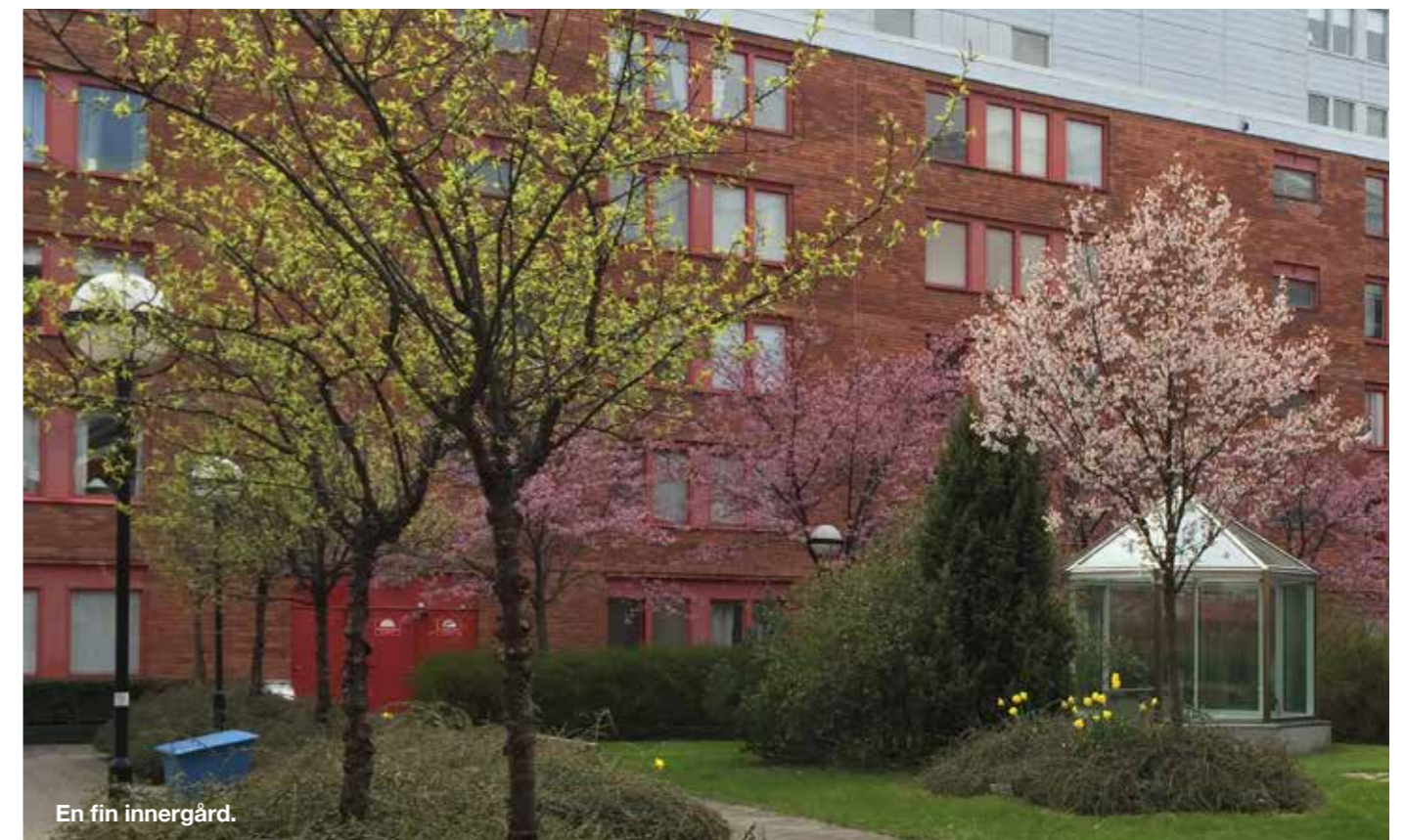
En fin innergård.