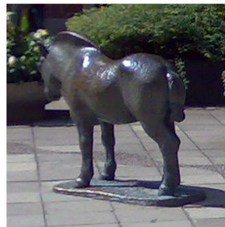
konsten om Fältöversten.

Tack så mycket alla engagerade medlemmar och hyresgäster om hörsammade min efterlysning från FP nr 3 2010. Ett speciellt tack vill jag framföra till Mite Ziemelis som tagit fram mycket information och