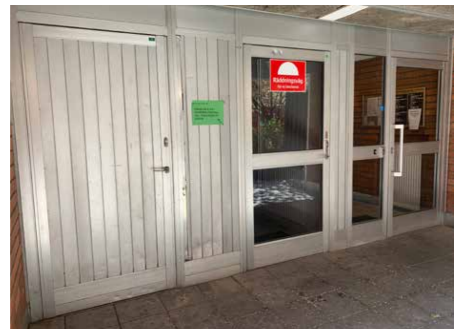
Exempel på entré 148D - bild före renovering.

aluminiumprofiler har klämts på utanpå de gamla. Resultatet är fantastiskt då alla bucklor och missfärgningar har försvunnit.