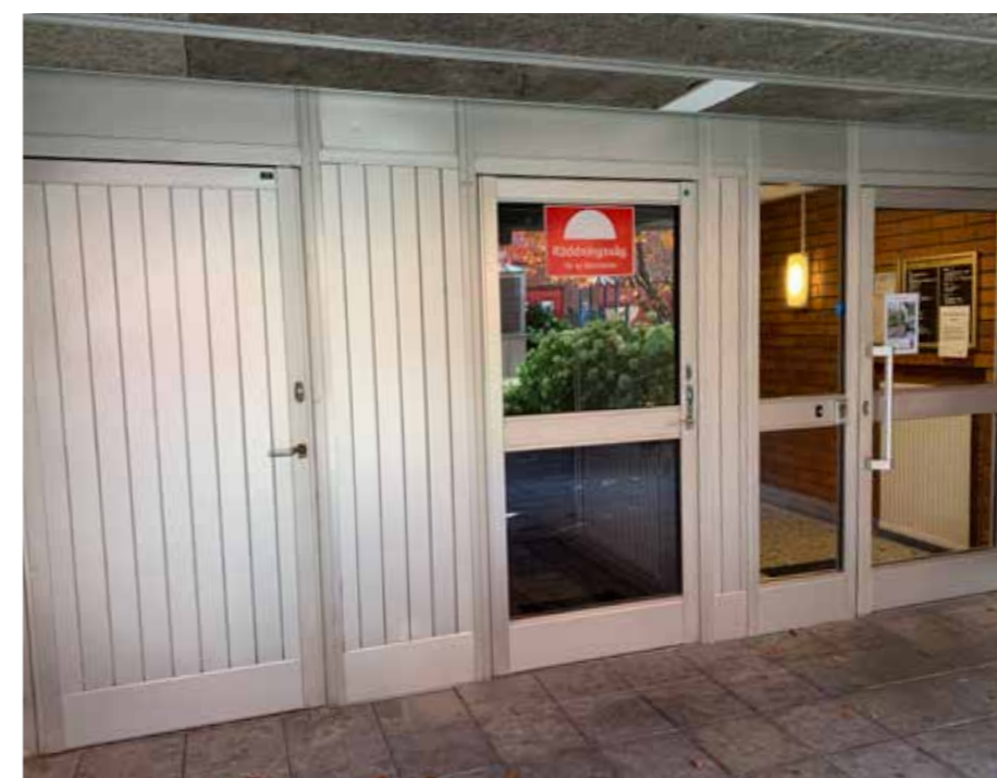
Exempel på entré 148D - bild efter renovering.