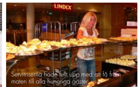
Servitriserna hade fullt upp med att få fram maten till alla hungriga gäster.