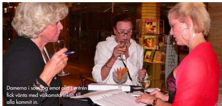
Damerna i som tog emot alla i entrén fick vänta med välkomstdrinken till alla kommit in.