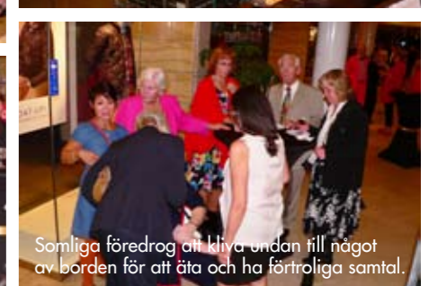
Somliga föredrog att kliva undan till något av borden för att äta och ha förtroliga samtal.