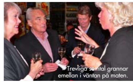
Trevliga samtal grannar emellan i väntan på maten.