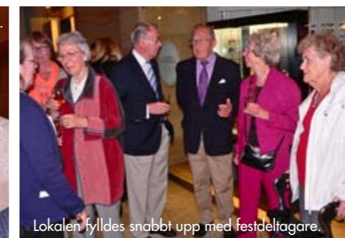
Lokalen fylldes snabbt upp med festdeltagare.