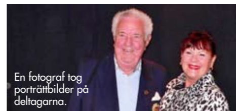
En fotograf tog porträttbilder på deltagarna.