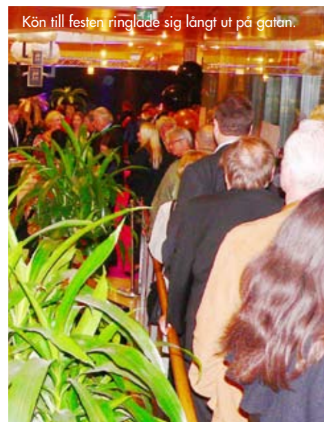
Kön till festen ringlade sig långt ut på gatan.