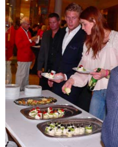
Maten fortsatte att serveras under hela kvällen.