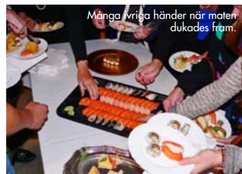
Många vriga händer när maten dukades fram.