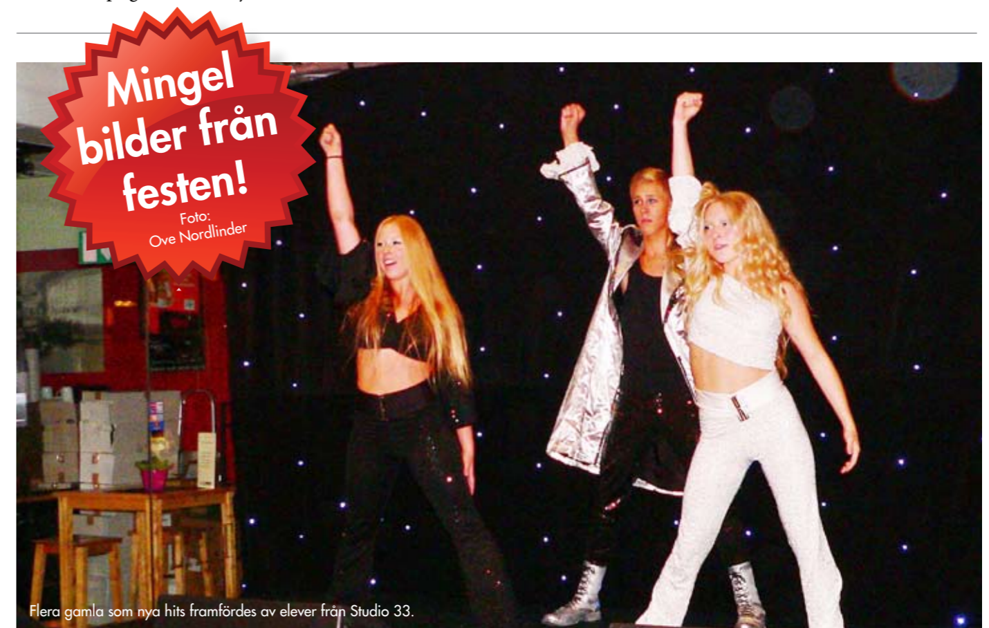
Flera gamla som nya hits framfördes av elever från Studio 33.